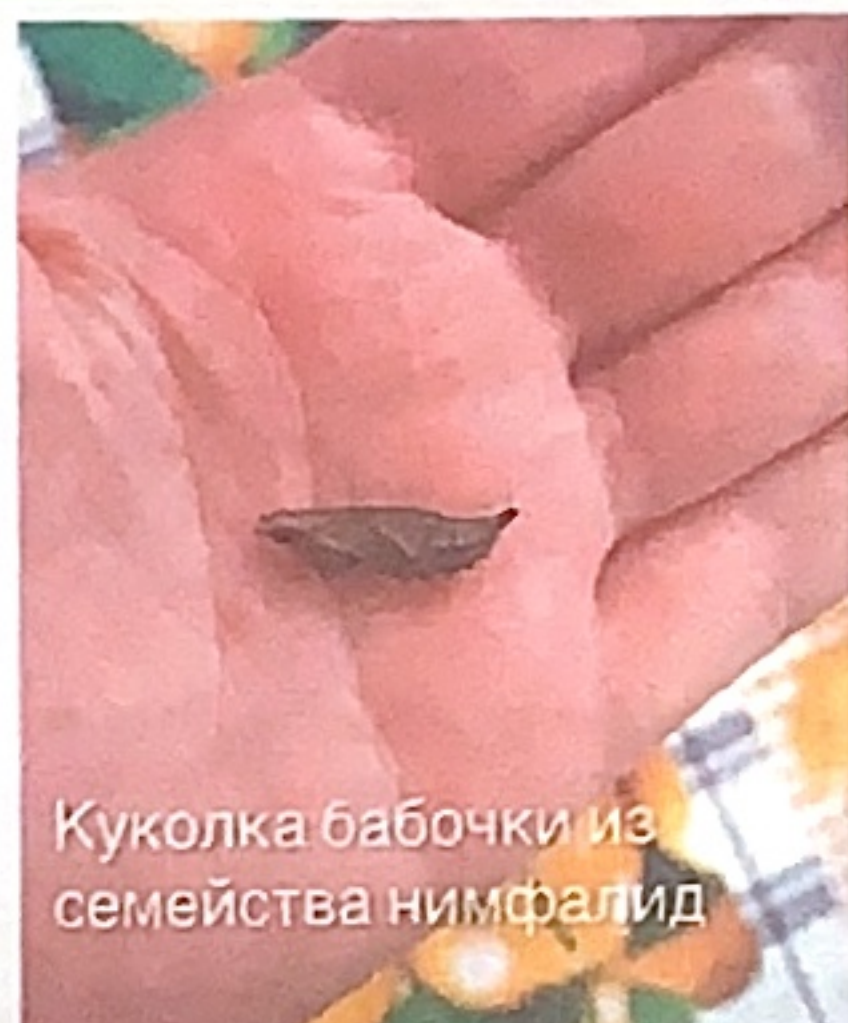
Куколка бабочки из семейства нимфалид

Присылайте свои вопросы о лесе. Я запрашиваю информацию у специалистов и размещаю на этом канале.